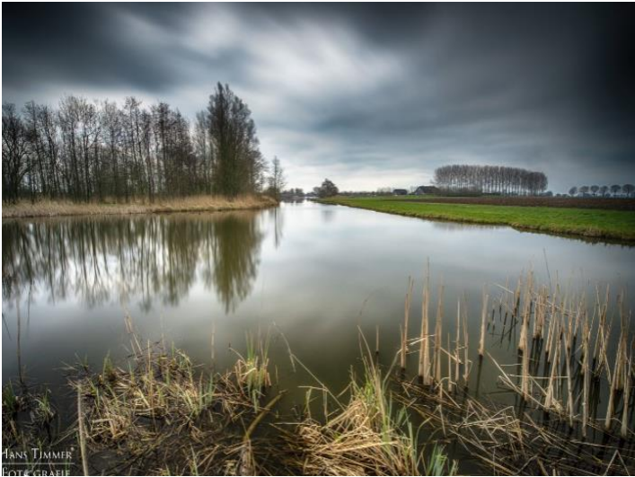
De wijde Alm.