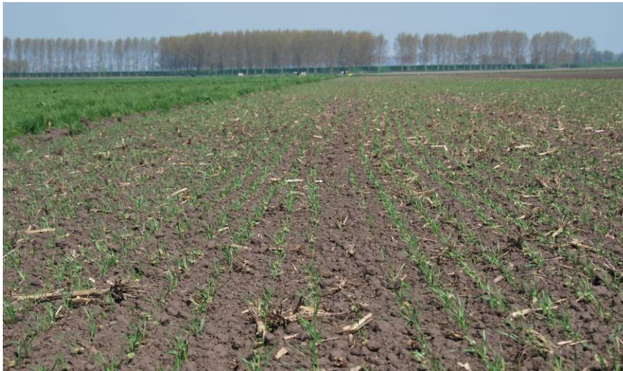
Het bloemrijke graanmengsel in deze, begin april ingezaaide, akkerrand komt snel tot ontwikkeling en zal vóór de ongewenste kruiden een dicht gewas vormen.

In de eerste week van april zijn de mengsels voor de akkerranden bij u afgeleverd. Deze mengsels zijn collectief ingekocht om de laagste prijs te garanderen. Dit jaar is een prijsopgave gedaan bij Van Dijke uit Tholen en bij Neutkens BV uit Vessem, waarbij Neutkens qua prijs het gunstigst uit de bus kwam. De exacte samenstelling van de mengsels is op te vragen bij uw gebiedscoördinator. U heeft een zaaiadvies ontvangen van uw gebiedscoördinator. Hopelijk was hierin handige informatie terug te vinden. De ingezaaide mengsels komen – bij een goede inzaaimethode - vlot op, zoals hieronder nabij Hooge Zwaluwe, genomen op 03-05-2013.