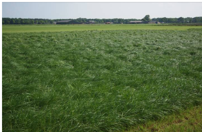
Na het spelen (links) begint het serieuze werk: het broeden. Een kuikenstrook (rechts) redt deze grutto's.