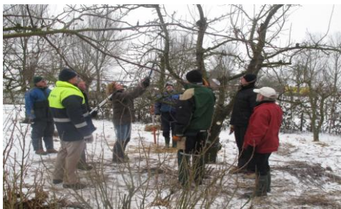
Snoeicursus van de ANV, winter '10-'11

Heb je zin om enkele dagdelen per jaar mee te snoeien, meld je dan per telefoon of mail bij Arjan Quartel ( awjquartel@hotmail.com ) of 06 12759694) of bij Patrick van Haren ( pfvanharen@casema.nl ) of 06 49137163)